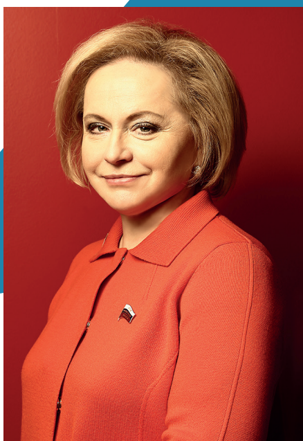
Любовь Николаевна Духанина, заместитель председателя Комитета по образованию и науке ГД РФ, член Центрального штаба ОНФ, координатор проекта «Равные возможности – детям»